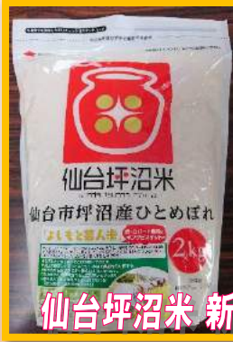
仙台坪沼米 新米ひとめぼれ販売会