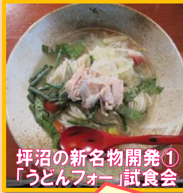
坪沼の新名物開発① 「うどんフォー」試食会