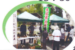
旬菜八百屋 おらほの産直